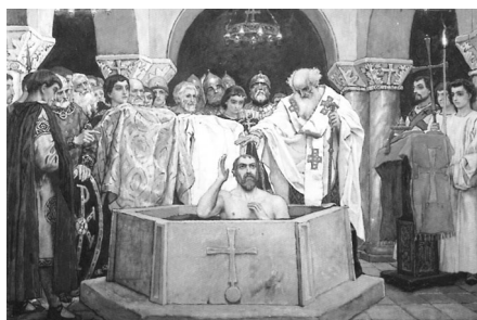
В. М. Васнецов. Крещение князя Владимира. Владимирский собор г. Киева.

■ Государственность стала главным цивилизационным итогом крещения Руси. Язычество по своему характеру не могло стать государствообразующим фактором. У вятичей был свой бог, у кривичей свой, у полян свой. Бог одной родо-племенной группы не был авторитетом для другой. В этом на опыте убедился сам князь Владимир, когда пытался модернизировать язычество, устроив