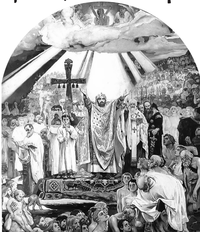
В. М. Васнецов. Крещение Руси. Владимирский собор г. Киева.

● Лишь в нескольких окраинных местах, где язычество стало духовным выражением политического сепаратизма, оно оказало