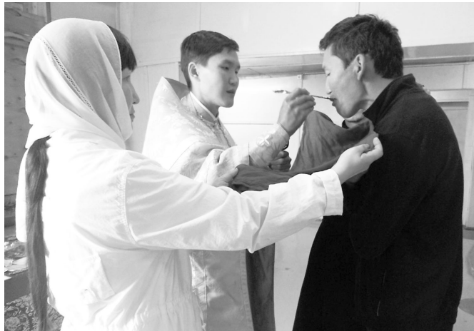
Причащение во время литургии на якутском языке. Якутия, 2013 г.

В Благовещенске на возвышенности (территория нынешнего ДальГАУ) находилось маньчжурское языческое капище. При освоении этих земель казаки сбросили идолы – бурханы в речку у подножья холма, откуда она и получила своё название – Бурхановка. Как и во времена крещения Древней Руси, слабые анимистические культы Дальнего Востока не могли стать