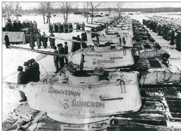
Танковая колонна «Дмитрий Донской», созданная на средства, собранные церковью.

■ Помимо хрестоматийных образов Осыяби и Пересвета история являет много примеров патриотической роли русского православия. Во